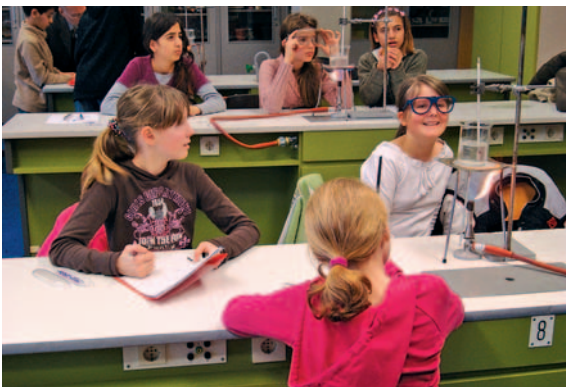
An der Hauptschule in Kiel Mettenhof ist NaWi-Aktiv schon gestartet.

An der Hauptschule im Schulzentrum Mettenhof in Kiel ist das Vorhaben direkt nach Ende der Herbstferien 2007 erfolgreich gestartet. 17 Schülerinnen und Schüler der NaWi-AG sind seitdem mit großem Interesse dabei. Und nebenbei haben sie einen Führerschein der besonderen Art erworben: den „Brennerführerschein“, Ausweis dafür, dass sie im Umgang mit Gasbrennern geschult sind und selbstständig mit den Geräten arbeiten können.